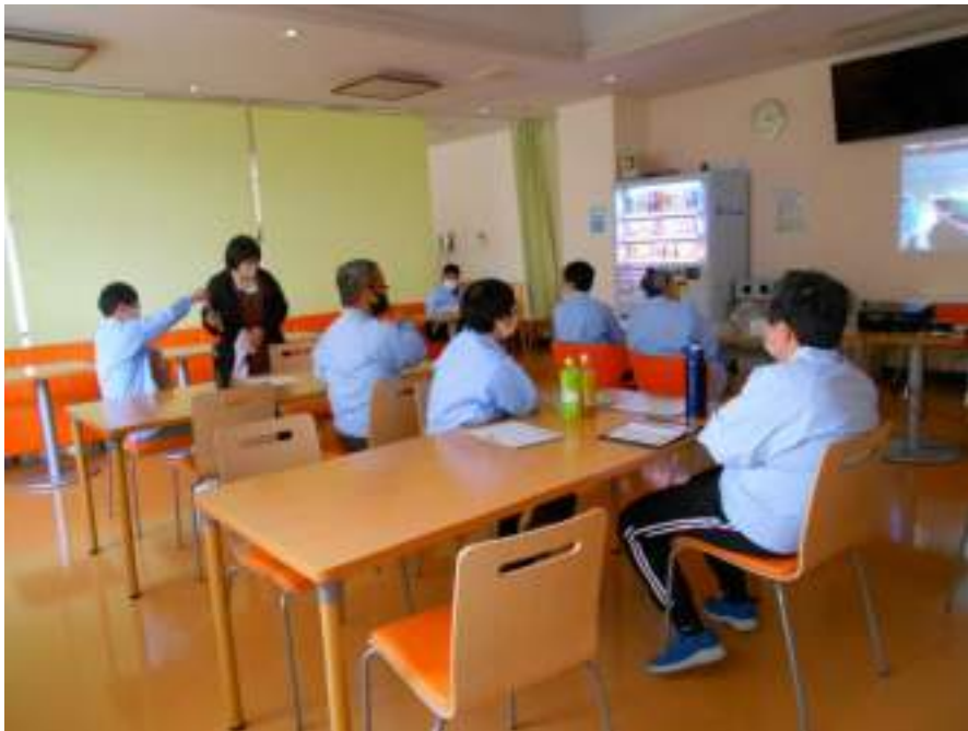
1月7日(水) カラオケクラブ①