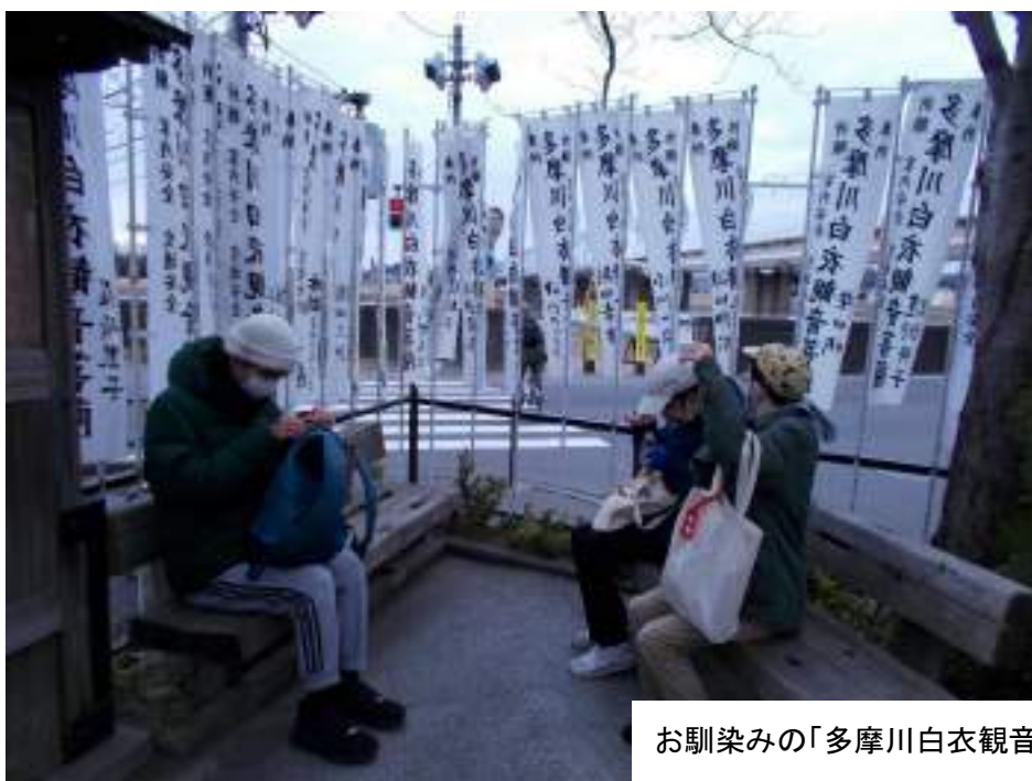
お馴染みの「多摩川白衣観音菩薩」